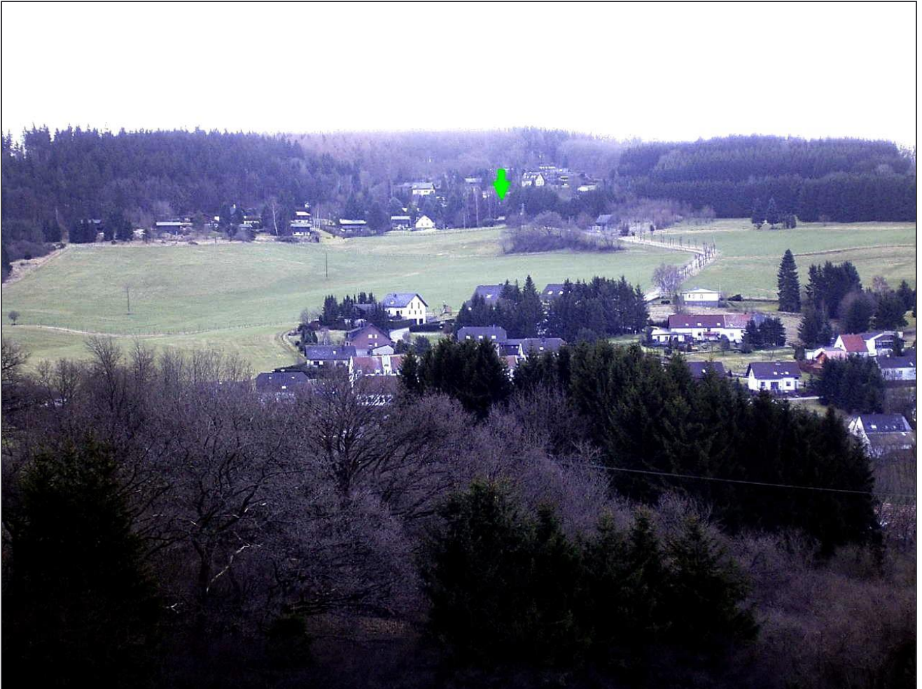
Standort: nördlicher Berghang des Kylltals mit Blickrichtung zum Grundstück (Pfeil).