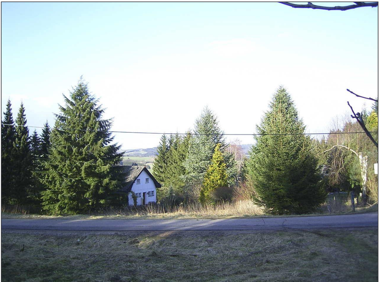
Standort: Etwa in der Mitte des Grundstücks.