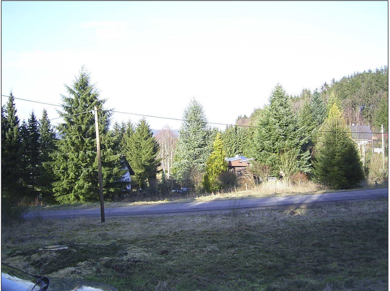
Standort: auf dem Bauplatz des Grundstücks.