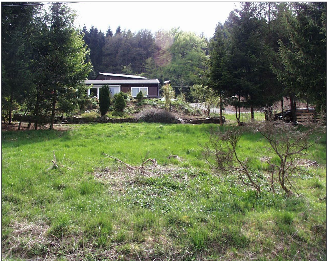
Standort: an der Einfahrt zum Grundstück (Sommer 2007).