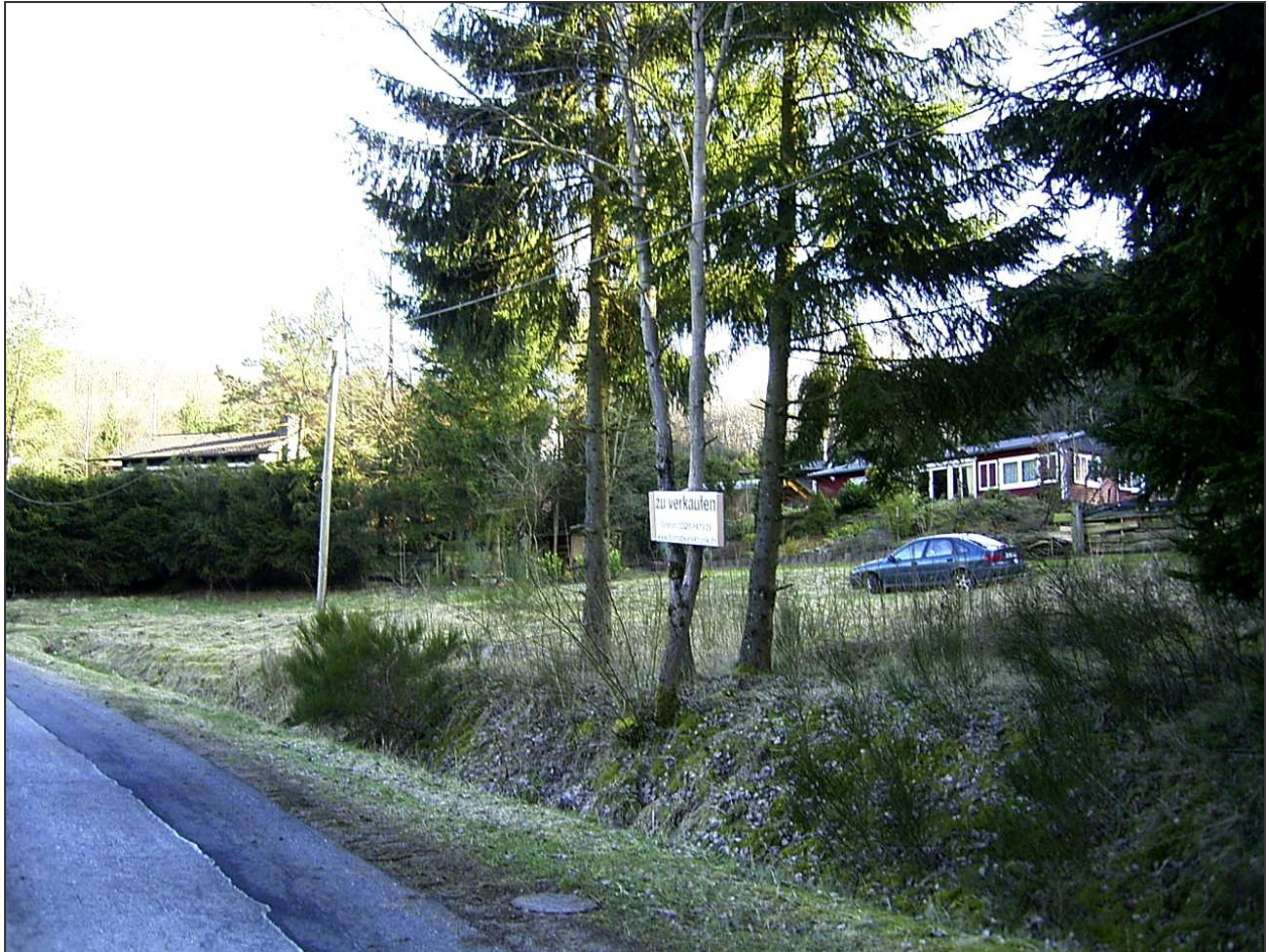
Standort: Auf der Straße am unteren Anfang des Grundstücks.