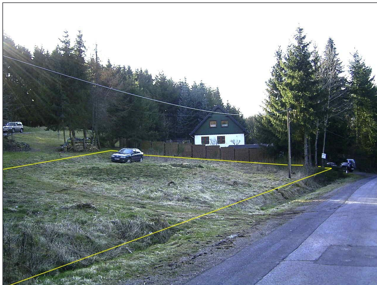
Standort: Auf der Straße fast am oberen Ende des Grundstücks.